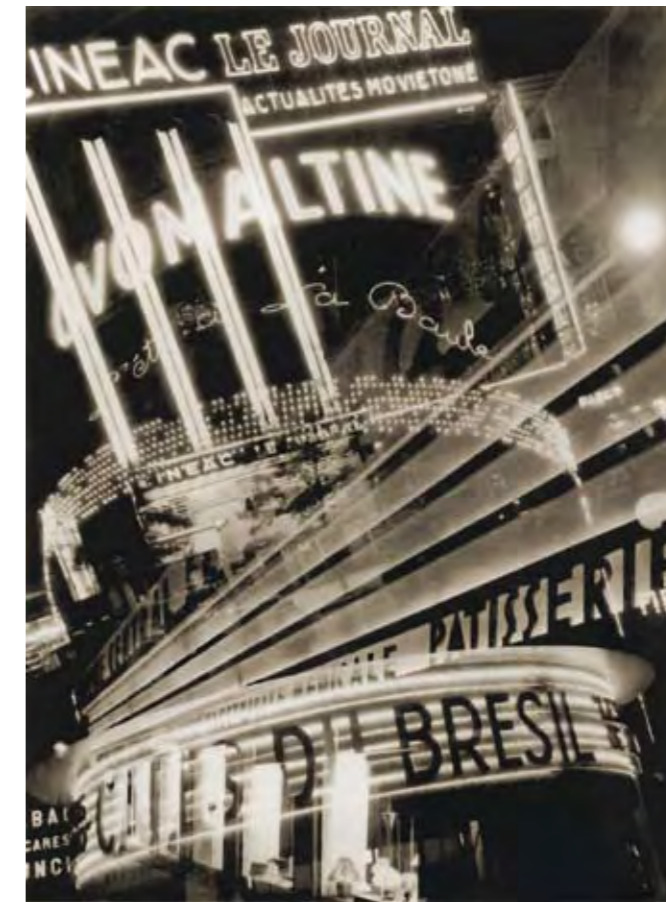
Francois Kollar. Die Lichter der Stadt. Werbung für Ovomaltine. 1932. Fotomontage. Privatsammlung.

wurden früh thematisiert, etwa die Blendungswirkung der ersten Elektrolampen, die anfangs ein äußerst grelles Licht ausstrahlten. So kritisiert der schottische Dichter Robert Louis Stevenson schon 1878 angesichts